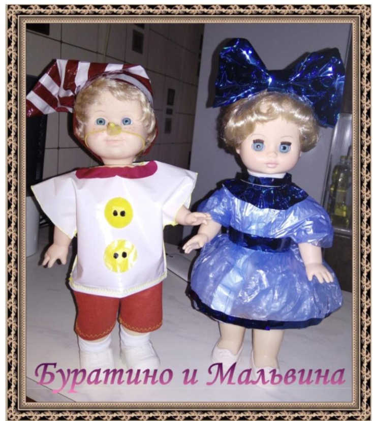
Буратино и Мальвина